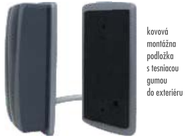
kovová montážna podložka s tesniacou gumou do exteriéru