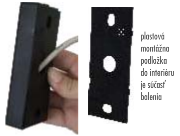
plastová montážna podložka do interiéru je súčasťou balenia

Pre montáž do exteriéru odporúčame doplniť čítačku ANTIKLON RFID o podložku s tesniacou gumou obj. č. 0012014008, ktorá chráni elektroniku čítačky pred vlhkosťou a prachom. Podložku je potrebné zakúpiť samostatne.